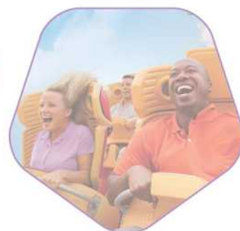
Universal Orlando Resort

Você pode escolher sua viagem dos sonhos no Universal Parks & Resorts em Hollywood ou Orlando!