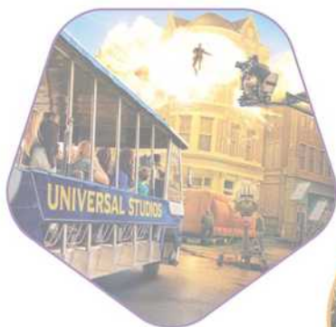
Universal Studios Hollywood